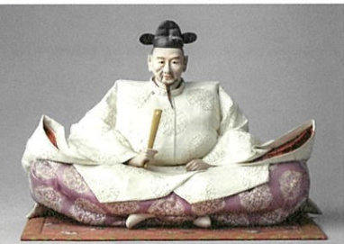
1.「助六」 昭和37~38年(1962~1963) / 2.提灯釣鐘弁慶 昭和25年(1950)頃 個人蔵 3.「同胞」 昭和15年(1940) / 4.白澤会同人合作 六歌仙 昭和10年(1935)頃 5.「豊太閤」 昭和29年(1954)以前 ※1、3~5はすべて、さいたま市岩槻人形博物館蔵