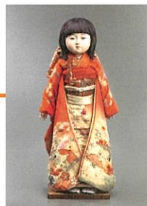
平田郷陽 市松人形 女子 昭和時代初期 さいたま市岩槻人形博物館蔵

展示室1「埼玉の人形作り」と、所蔵品の様々な人形を紹介する展示室2「コレクション展示 日本の人形」があります。ウェルカムケースには、市松人形の最高峰と称される平田郷陽の市松人形が初登場。必見です!