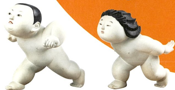
岡本玉水「前進」昭和16年(1941) 個人蔵