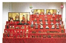
天野家雑役(昭和初期の再現展示) 令和3年(2021)撮影 さいたま市岩槻人形博物館蔵

にんばく恒例の雑祭り展。今回は、当館のコレクションから商家に由来する雑人形とその魅力を紹介。商家を彩った華やかなお雑さをお楽しみください。