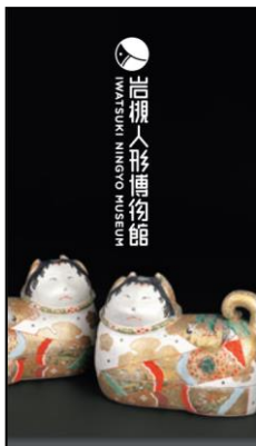
〈デザイン面〉 〈乗車券面〉 ※自動改札機には投入できません。